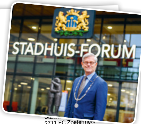
Stadhuis-Forum 2711 EC Zoetermeer